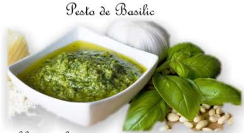
Pesto de Basilic