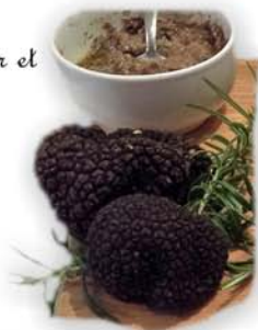
Truffe Noir et Blanche.