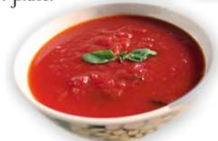
Sauce Tomate et Basilic